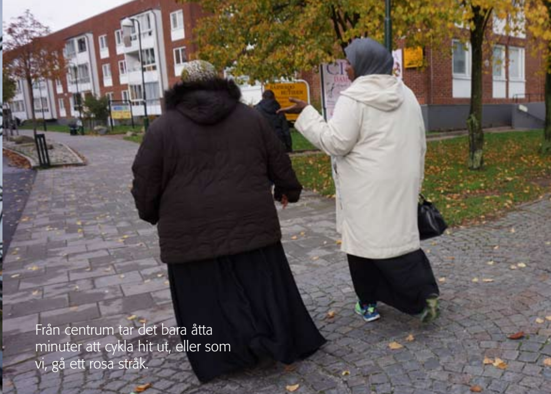
Från centrum tar det bara åtta minuter att cykla hit ut, eller som vi, gå ett rosa stråk.