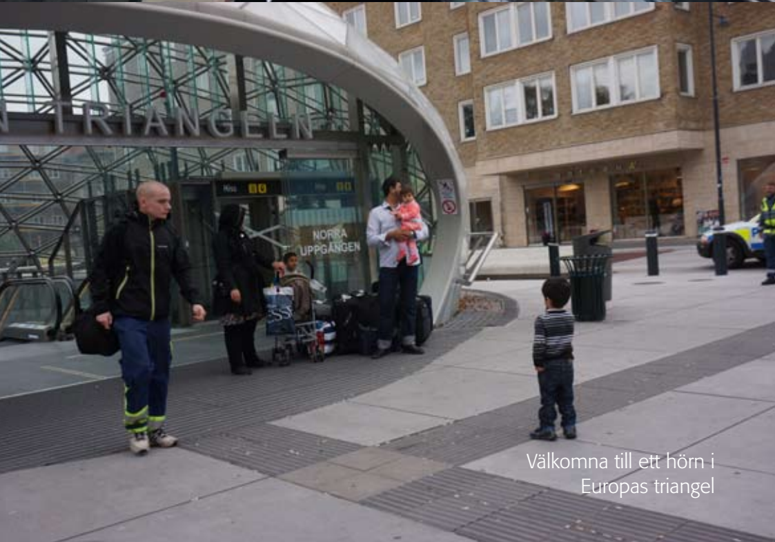
Välkomna till ett hörn i Europas triangel