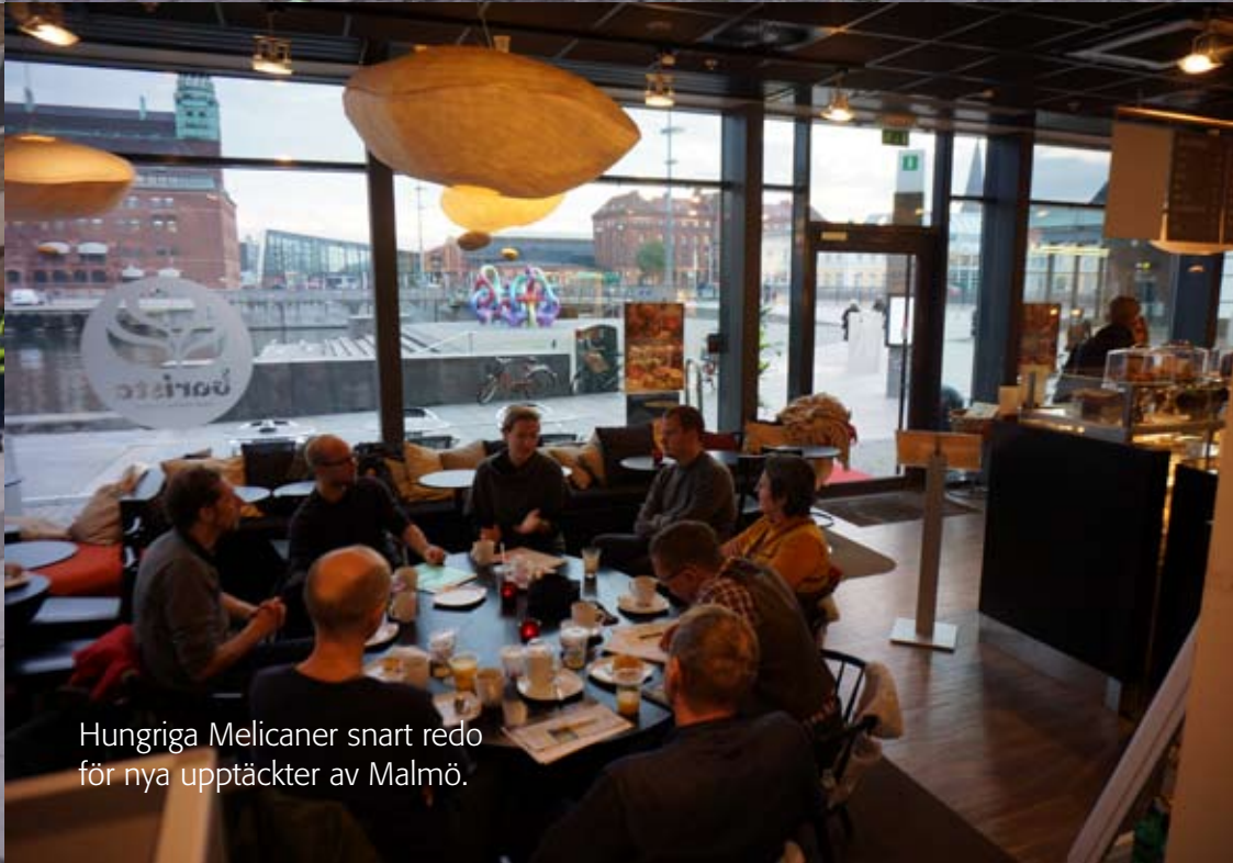
Hungriga Melicaner snart redo för nya upptäckter av Malmö.